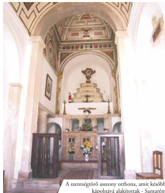
A szentségtörő asszony otthona, amit később kápolnává alakítottak - Santarém