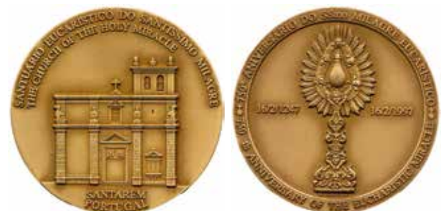
A santarémi csoda tiszteletére készült emlékérem