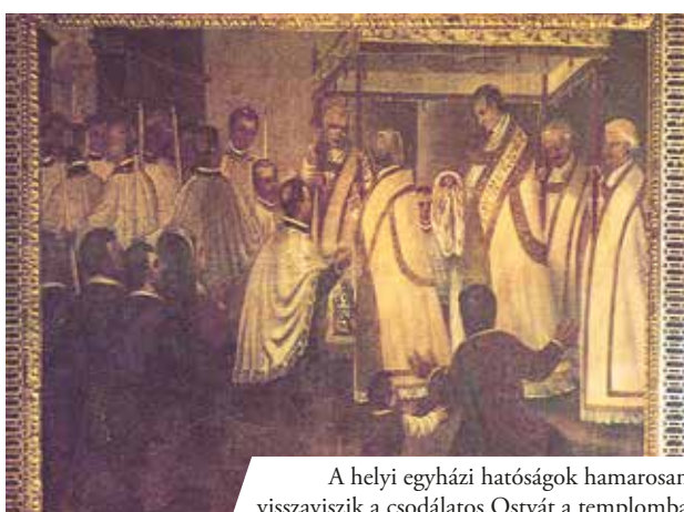
A helyi egyházi hatóságok hamarosan visszaviszik a csodálatos Ostyát a templomba