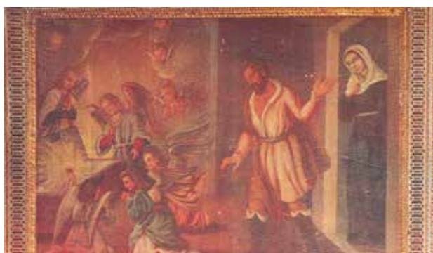
Az asszony férje felfedezi a lopást, mivel észreveszi, hogy fény sugárzik a szekrényből. Kinyitja a szekrényajtót, és megtalálja a vérvörös, eleven testté változott Szentostyát.