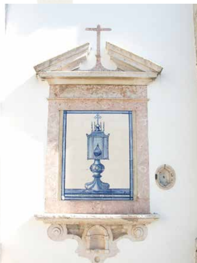
Pedro Crasbeeck: 1612-ből származó nyomat az üvegcséről, amibe a csodában szereplő Ostya átkerült