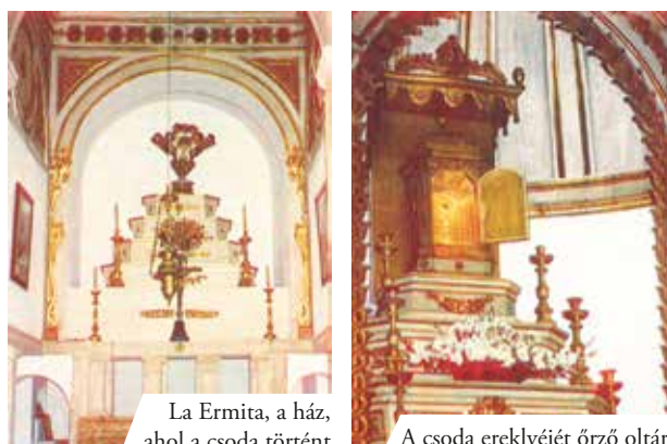
La Ermita, a ház, ahol a csoda történt