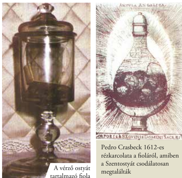
A vérző ostyát tartalmazó fiola