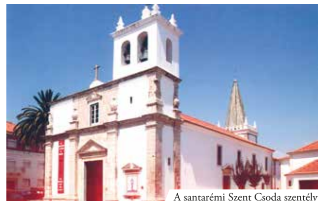
A santarémi Szent Csoda szentély