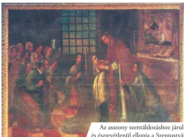
Az asszony szentáldozáshoz járul, és észrevétlenül ellopja a Szentostyát