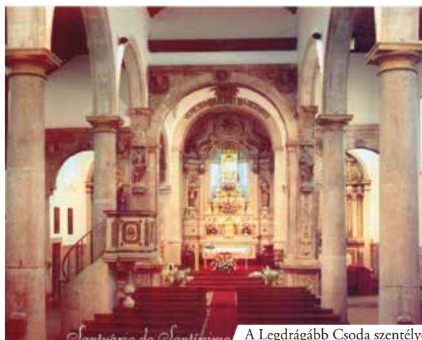
A Legdrágább Csoda szentélye

A santarémi eucharisztikus csodát a lancianoival együtt a legjelentősebb csodák között tartják számon. Az ereklyéről számos tanulmány íródott, amiket az Egyház alaposan kivizsgált. A Szentostya eleven hússá változott, amiből vér folyt ki. A két ereklyét napjainkban is a santarémi Szent István-templomban őrzik. A házaspár otthonát 1684-ben kápolnává alakították.