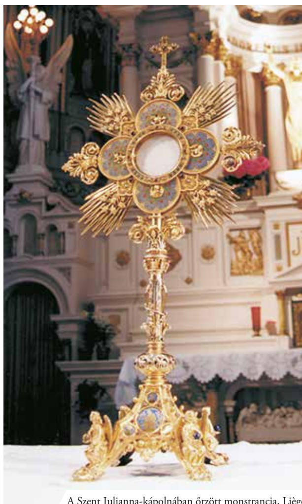
A Szent Julianna-kápolnában őrzött monstrancia, Liège

„Jóllehet az Eucharisziát az év minden napján ünnepeljük, évente egyszer kiemelt figyelmet is fordítunk Krisztus Testének ünneplésére. Szívünk és lelkünk bármilyen körülmények között és helyzetben fordulhat az Úrhoz, az ő valós jelenlétével azonban leginkább az Eucharisziában, a szentségi színek alatt találkozunk. Jézus az Eucharisziában – a kenyér és bor színe alatt- lényegi valóságában van jelen számunkra. Mennybementelekor a feltámadt Jézus ezt mondta: »Íme én veletek vagyok minden nap a világ végezetéig.« (Mt 28,20) ...Itt maradt és velük volt testi jelenlétével is.” IV. Orbán pápa Transiturus de hoc mundo kezdetű bullájából