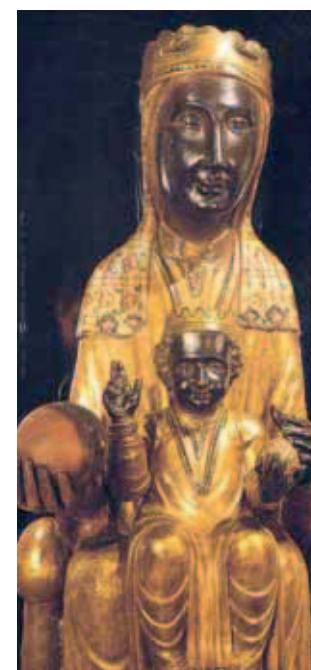
A Senhora milagrosa de Montserrat