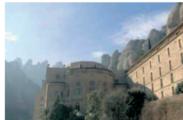
Santuário da N. Senhora de Montserrat