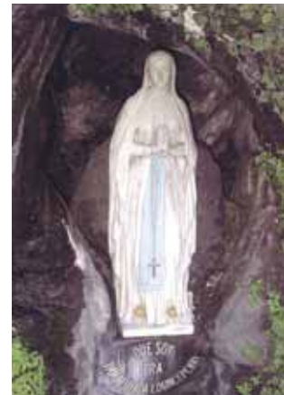
Estátua de Nossa Senhora na Gruta onde apareceu a Bernardete