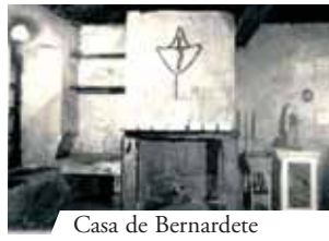
Casa de Bernardete