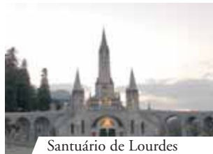
Santuário de Lourdes

Quando um sacerdote francês da Peregrinação Nacional propôs em 1888 realizar uma procissão com o Santíssimo Sacramento em Lourdes, ocorreu uma cura prodigiosa. Desde então, os doentes que vão a Lourdes em peregrinação são abençoados com o Santíssimo Sacramento e são incalculáveis as curas milagrosas ocorridas durante a passagem do Santíssimo. O Santuário de Lourdes é um exemplo luminoso da fé na presença real de Jesus na Eucaristia.