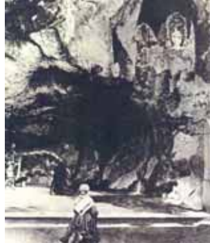
Uma das mais antigas fotografias de Bernardete na Gruta (1864)