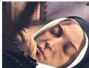
O corpo incorrupto de Santa Bernardete na Casa Madre das Irmãs da Caridade em Nevers