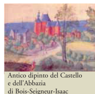
Antico dipinto del Castello e dell'Abbazia di Bois-Seigneur-Isaac