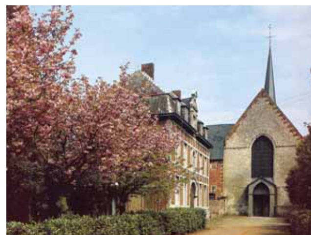
Abbazia Premostratense, Cappella del Santo Sangue