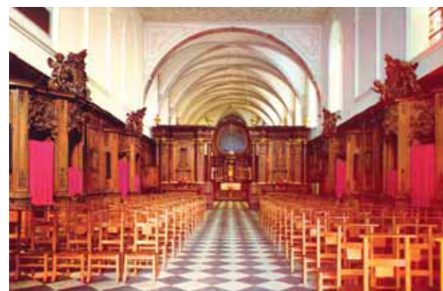
Interno della Cappella del Santo Sangue