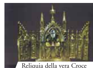
Reliquia della vera Croce