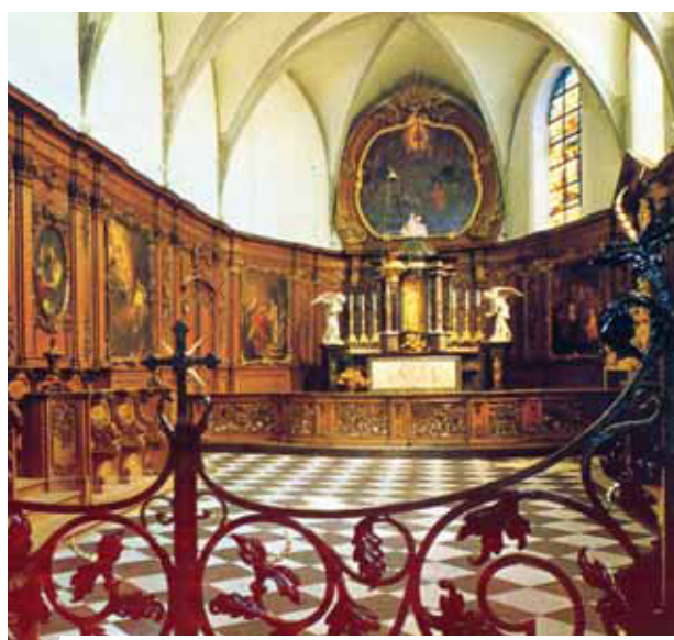
Coro della Cappella del Santo Sangue

Nel Miracolo Eucaristico di Bois-Seigneur-Isaac, l'Ostia consacrata sanguinò e macchiò il Corporale della Messa. Il 3 maggio del 1413, il Vescovo di Cambrai, Pierre d'Ailly, autorizzò il culto della Sacra Reliquia del Miracolo. La prima processione si tenne nel 1414. Il 13 gennaio del 1424, il Papa Martino V, approvò ufficialmente l'erezione del Monastero di Bois-Seigneur-Isaac. Ancora oggi il Monastero è meta di pellegrinaggi, e nella sua Cappella è possibile venerare la Sacra Reliquia del Corporale macchiato di Sangue.