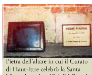
Pietra dell'altare in cui il Curato di Haut-Ittre celebrò la Santa Messa dove si verificò il Miracolo