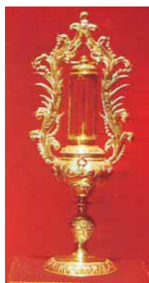
Reliquia di una spina della corona di Gesù