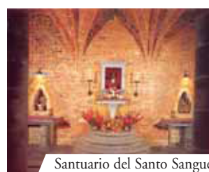
Santuario del Santo Sangue, Cappella delle Reliquie