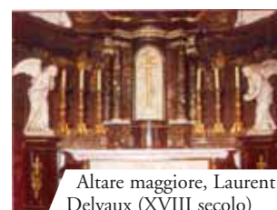
Altare maggiore, Laurent Delvaux (XVIII secolo)