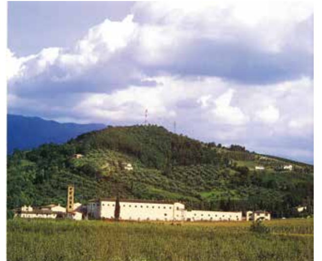
Eine Innschrift besagt, dass die Abtei von S. Maria di Rosano im Jahre 780 gegründet wurde