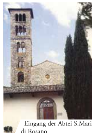
Eingang der Abtei S. Maria di Rosano