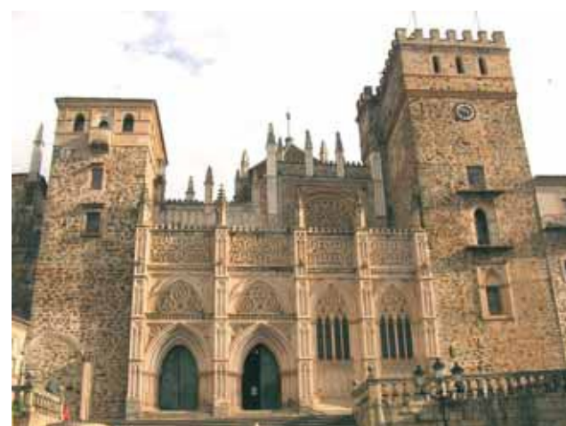
Kirche von Guadalupe