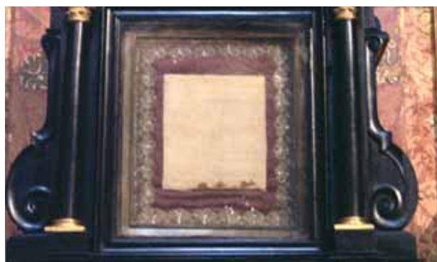
Reliquie des blutbefleckten Altartuches