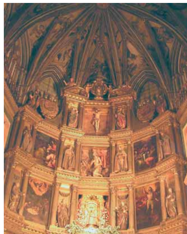
Innenansicht der Kirche Madonna di Guadalupe

N och heute kann man in der Wallfahrtskirche von Guadalupe die wertvollen Reliquien des blutbefleckten Korporale und der Palla (quadratisches, gestärktes Leinentuch, welches den Messkelch und die Patene abdeckt) bestaunen, welche von dem ehrwürdigen Don Pedro Cabanuelas in der Wundermesse verwendet wurden. Dieser Priester war ein eifriger Verehrer der Eucharistie und verbrachte viele Stunden betend vor dem Allerheiligsten Sakrament. Trotzdem geschah, dass Don Pedro Zweifel an der wahren Gegenwart Christi in der Eucharistie kamen. Im Herbst des Jahres 1420, während der Messe, sofort nach den Worten der Weihung, sah Don Pedro eine dichte Wolke auf dem Altar. Sie hatte sich plötzlich gebildet und verhinderte ihm die Sicht. Da verstand Don Pedro und betete zu