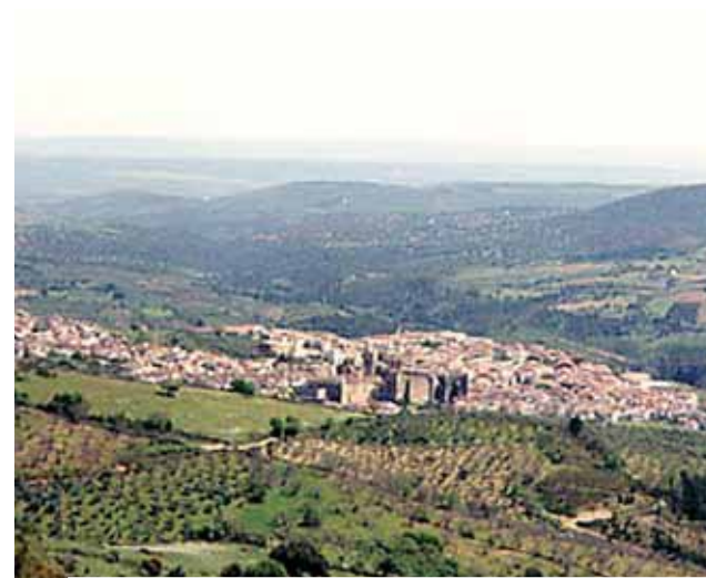
Ansicht von Guadalupe