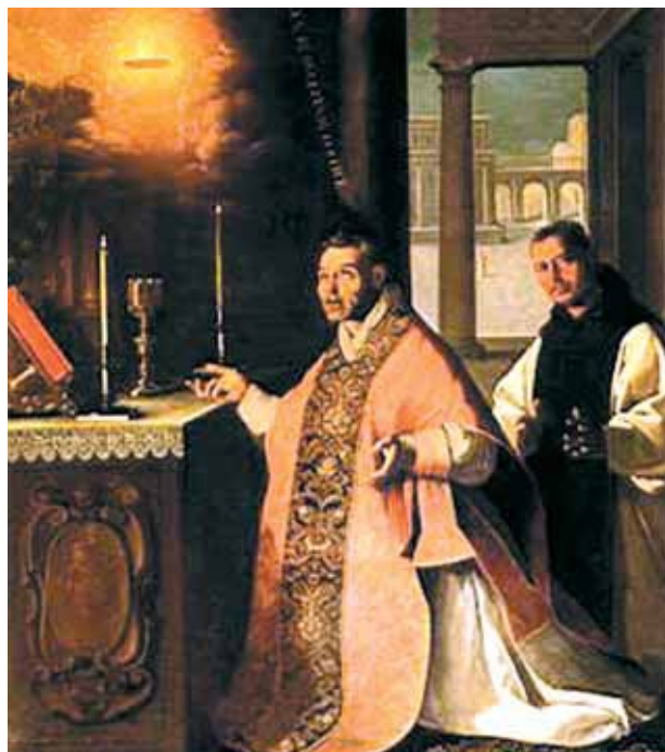
Francisco de Zurbarán, Darstellung des Wunders

Während des Gottesdienstes hatte ein Priester die Gnade, die Hostie bluten zu sehen. Das Wunder festigte den Glauben des Gottesmannes und fand viele Verehrer, unter diesen war auch die königliche Familie von Kastilien. Es gibt eine umfangreiche Dokumentation über das Geschehnis und noch heute sind die Reliquien Objekt der Verehrung. Im Jahre 1926, während des Eucharistischen Kongresses von Toledo wurden die Reliquien zur öffentlichen Anbetung ausgestellt.