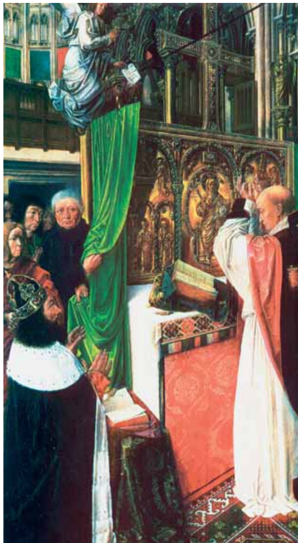
A Missa de Santo Egídio diante de Carlos Martello, National Gallery, Londres