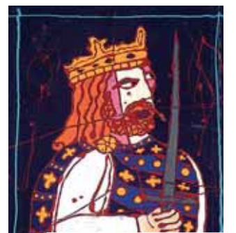
Vitrail no qual Carlo Martello é representado