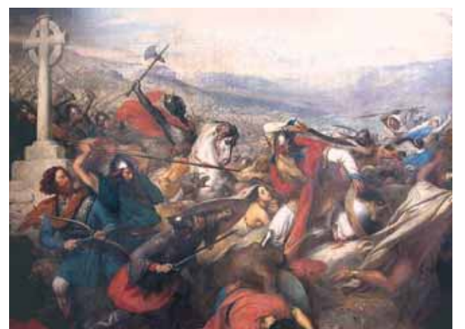
Jean-Honoré Gonon, A Batalha de Carlos Martello e d'Abdeherame, rei dos Saracenos

Antes de celebrar a vitória sobre os Sarracenos em Poitiers, Carlo Martello tinha cometido incesto com a sua irmã. Arrependido, não se atrevia confessar o próprio pecado, pois via como era infame o ato cometido.