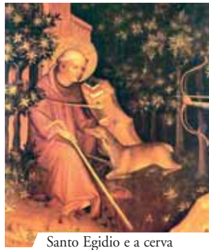
Santo Egídio e a cerva

Santo Egídio celebrou uma Missa por essa intenção, mas eis que um anjo apareceu e se colocou perto do altar; tinha na mão um livro no qual estava escrito a culpa não confessada. Durante a Missa, as palavras escritas no livro foram clareando-se até desaparecerem completamente e Carlos Martello foi absolvido.