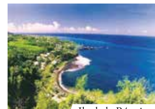
Ile de la Réunion