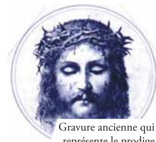
Gravure ancienne qui représente le prodige