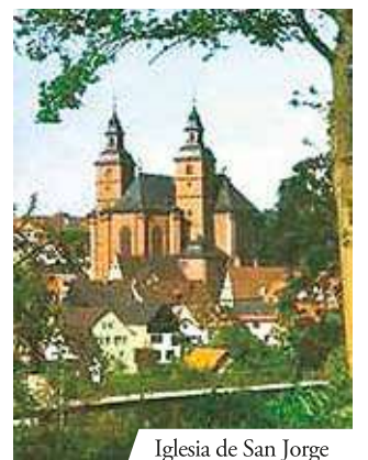
Iglesia de San Jorge