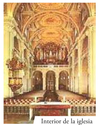
Interior de la iglesia