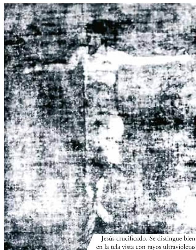
Jesús crucificado. Se distingue bien en la tela vista con rayos ultravioletas

sas. El Papa Eugenio IV confirmó el Milagro en 1445 y le concedió algunas indulgencias. El Prodigio fue conocido en toda Europa, haciéndose muy famoso. La prueba de ello está en que fue motivo de inspiración para muchos artistas. La actual Basílica fue construida entre 1698 y 1728 por Franz Lothar von Schönborn, Arzobispo de Mainz. En 1962, el Papa Juan XXIII la elevó a Basílica Menor. Desde 1938 los monjes agustinos asumieron el cuidado de esta Basílica.