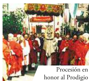
Procesión en honor al Prodigio