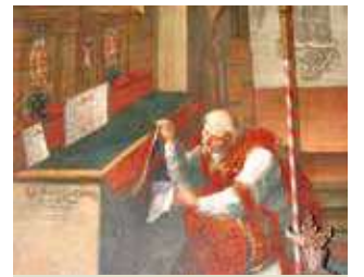
El Padre Otto esconde el corporal milagroso. Pintura del 1732, conservada en la iglesia de San Jorge