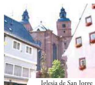
Iglesia de San Jorge