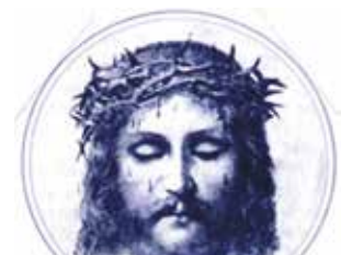
Grabado antiguo con la representación del Prodigio