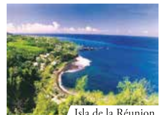
Isla de la Réunion