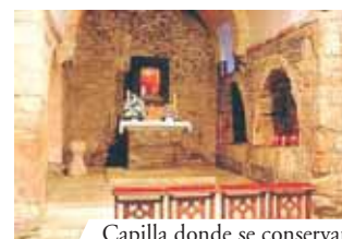
Capilla donde se conservan las Reliquias del Prodigio