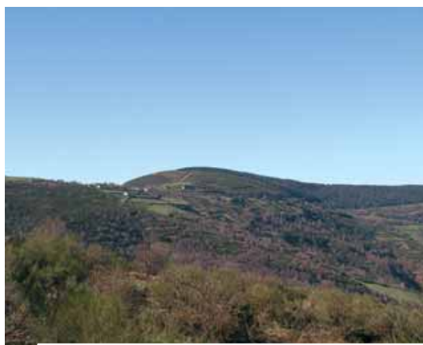
Vista panorámica de O'ebreiro