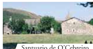
Santuario de O'ebreiro