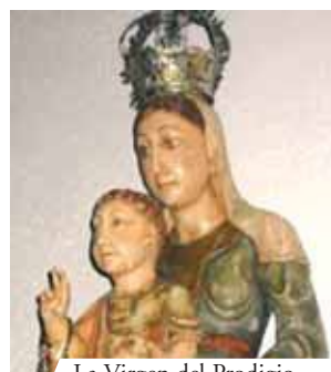
La Virgen del Prodigio