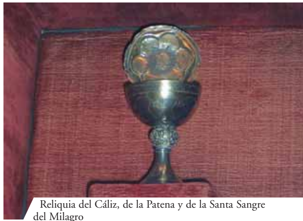
Reliquia del Cáliz, de la Patena y de la Santa Sangre del Milagro

El Señor obró este Prodigio para sostener la poca fe del sacerdote que no creía en la presencia real de Jesús en la Eucaristía. Las Sagradas Reliquias del Milagro se conservan hasta el día de hoy en la iglesia donde sucedió el Prodigio. Cada año, son muchos los peregrinos que acuden para venerar este Milagro.