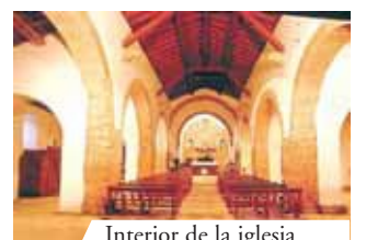
Interior de la iglesia de Santa María