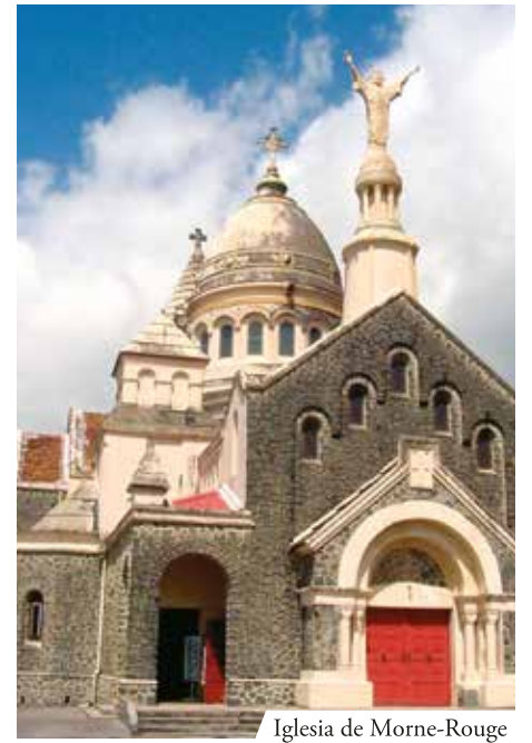
Iglesia de Morne-Rouge