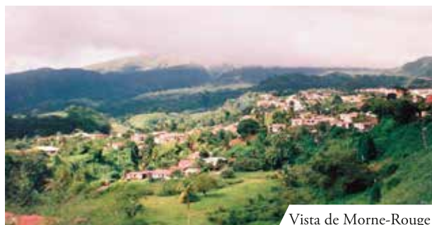
Vista de Morne-Rouge