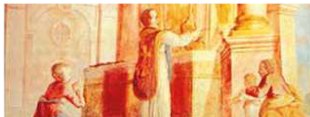
La familia Batthyány mandó llamar en 1753 al pintor Mihael Peck para realizar en la capilla del castillo donde sucedió el Milagro, los frescos con la representación de las fases del Prodigio.