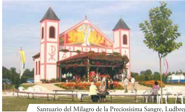
Santuario del Milagro de la Preciosísima Sangre, Ludbreg

La Reliquia de la Sangre se conserva perfectamente intacta en una riquísima Custodia, realizada por encargo de la Condesa Eleonora Batthyány-Strattman en 1721.