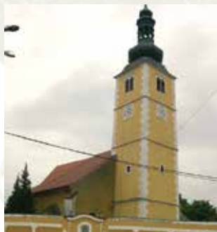
Capilla del Castillo de la familia Batthyany donde sucedió el Milagro.