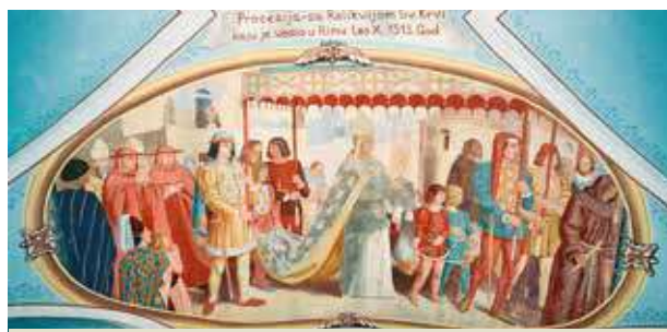
Fresco que representa la procesión de 1513, en Roma. El Papa León X porta la preciada Reliquia por las calles de la ciudad.