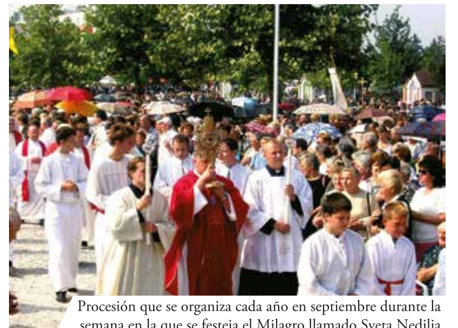
Procesión que se organiza cada año en septiembre durante la semana en la que se festeja el Milagro llamado Sveta Nedilja