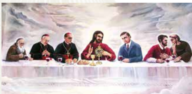
Marijan Jakubin, La Última Cena , Santuario del Milagro de la Preciosísima Sangre, Ludbreg