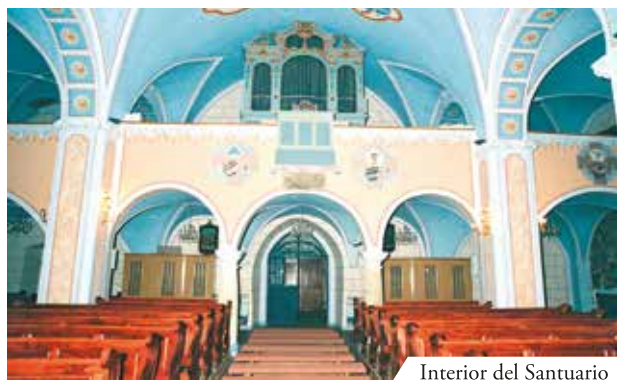
Interior del Santuario