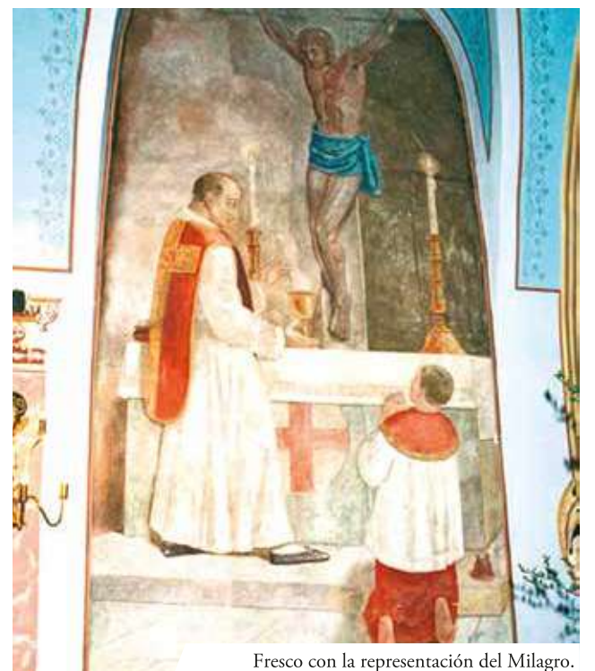
Fresco con la representación del Milagro.

E n 1411, en Ludbreg, en la capilla del castillo de los condes Batthyány, un sacerdote celebró la Misa. Durante la consagración del vino, el sacerdote dudó de la verdad de la transubstanciación. Fue entonces, cuando el vino contenido en el cáliz se transformó en Sangre. Lleno de confusión, escondió la Reliquia detrás de un muro del altar principal. El albañil que realizó el trabajo fue obligado a guardar silencio. El sacerdote mantuvo el secreto, pero poco antes de morir reveló el Milagro. Luego de su confesión, la noticia se difundió velozmente y Ludbreg se convirtió en meta de peregrinaciones. Poco después, la Santa Sede mandó que la Reliquia del Milagro fuese llevada a Roma, donde permaneció por largos años. El pueblo de Ludbreg y los alrededores continuaron la costumbre de peregrinar hacia la ca-