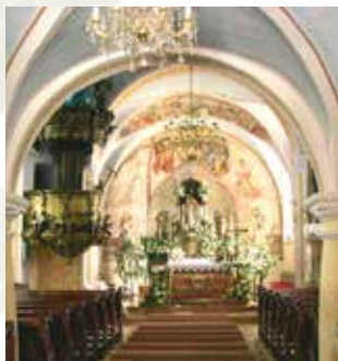
Interior de la capilla del castillo de la familia Batthyány.