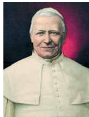
Pío IX proclamó el Dogma de la Inmaculada Concepción "Ineffabilis Deus" en 1854