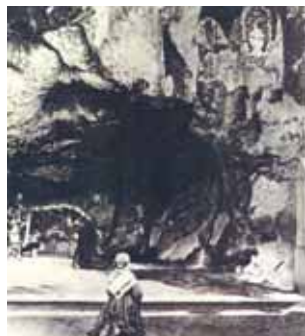
Una de las más antiguas fotografías de Bernadette en la gruta (1864)