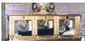
El cuerpo incorrupto de Santa Bernadette en la casa madre de las Religiosas de la Caridad en Nevers