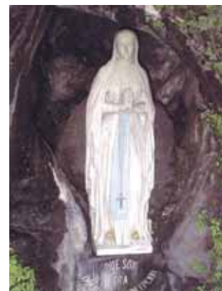
Estadua de la Virgen en la misma gruta donde se apareció ante Bernadette