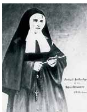
Santa Bernadette decide abrazar la vida religiosa y entró en el Convento de las Religiosas de la Caridad en Nevers