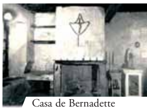
Casa de Bernadette