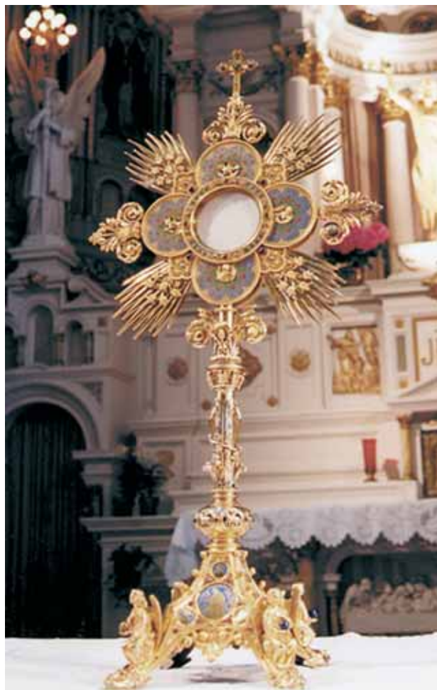
Custodia que se conserva en el Santuario de Santa Giuliana, Liegi