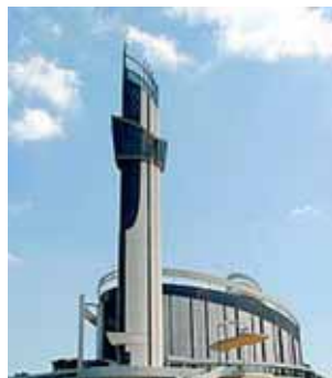
Santuario de la Divina Misericordia, Cracovia