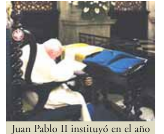
Juan Pablo II instituyó en el año 2000 la fiesta litúrgica de la Divina Misericordia para que sea celebrada cada año, el primer domingo después de la Pascua.

Jesús a Santa Faustina: "Hija Mía, ayúdame a salvar a un pecador agonizante; recita por él la corona que te he enseñado". Cuando comencé a recitar la corona, vi a aquel moribundo entre tormentos y luchas atroces. El Ángel de la Guarda lo defendía, sin embargo, era impotente ante la gran miseria de aquella alma. Una multitud de demonios estaba a la espera de aquella alma, pero mientras yo recitaba la corona vi a Jesús igual a la imagen pintada. Los rayos que salieron del Corazón de Jesús envolvieron al enfermo y las potencias de las tinieblas huyeron, no sin provocar un gran ruido. El enfermo expiró serenamente. Cuando entré nuevamente en mí comprendí que esta corona es importante junto a los moribundos, ella aplaca la ira de Dios".