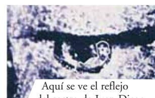
Aquí se ve el reflejo del rostro de Juan Diego

Al amanecer del 9 de diciembre de 1531, un joven indio llamado Juan Diego subió por las colinas del Tepeyac que quedaba a las afueras de la ciudad de Méjico. Se dirigía a Tlatelolco para sus clases de catecismo. De pronto, oyó un suave canto y se dirigió al lugar de donde provenía el sonido. Se encontró con una mujer joven que tenía resplandecientes vestidos. Ella le reveló ser la Virgen María. Luego, rogó a Juan Diego que fuese donde el Obispo de la capital para pedirle la construcción de un templo en el lugar donde ella se había aparecido para que todos pudiesen honrar a su Hijo Jesús. Juan Diego obedeció, pero el Obispo, Juan de Zumárraga, pidió una señal porque se mostraba incrédulo ante la narración. Cuando la Virgen apareció por tercera vez a Juan Diego, le prometió que le daría una señal al día siguiente. Pero ese día, un lunes, Juan Diego no