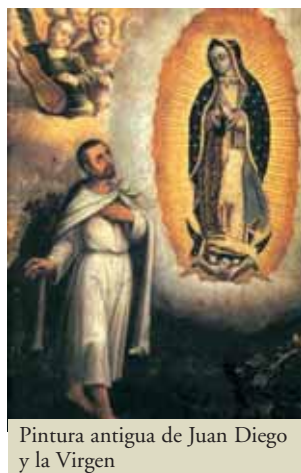
Pintura antigua de Juan Diego y la Virgen