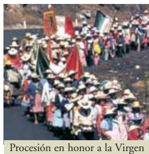
Procesión en honor a la Virgen