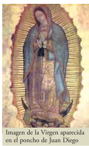
Imagen de la Virgen aparecida en el poncho de Juan Diego

El 6 de mayo de 1999, Juan Pablo II se dirigió en peregrinación a la imagen de la Virgen de Guadalupe