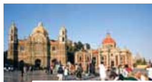
Basílica antigua de Guadalupe