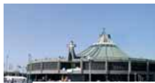
Nuevo Santuario de Guadalupe

La base indiscutiblemente histórica de la Eucaristía es la Encarnación del Hijo de Dios. “Carne de Cristo, carne de María”, dice San Agustín. La Iglesia “en María contempla con gozo, como a través de una imagen purísima, aquello que ella desea y espera ser en toda su integridad” (SC 103), es decir, tabernáculo, vientre, custodia. La Virgen se apareció en Guadalupe con una túnica ajustada a la cintura con un lazo negro, idéntico a la usanza típica de las mujeres en gestación.