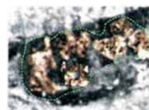
Ampliación de las imágenes presentes en los ojos de la Virgen