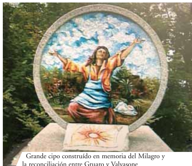
Grande cipo construido en memoria del Milagro y la reconciliación entre Gruario y Valvasone