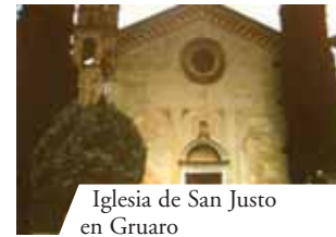
Iglesia de San Justo en Gruario