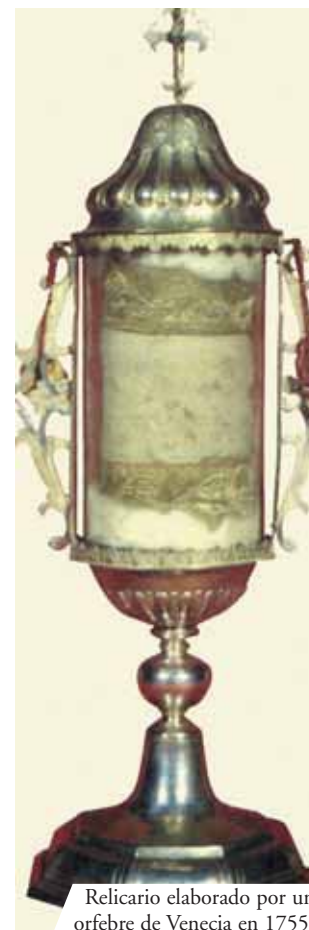
Relicario elaborado por un orfebre de Venecia en 1755