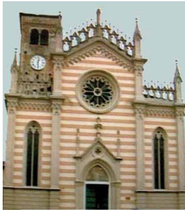
En la Iglesia del Santísimo Cuerpo de Cristo, en Valvasone, se custodia el mantel de lino ensangrentado

Entre los documentos de mayor autoridad que dan testimonio del Milagro Eucarístico de Gruario está el del historiador del lugar, Antonio Nicoletti (1765). Una mujer estaba lavando un mantel de altar de la iglesia de San Justo en el lavadero construido en la acequia del Versiola. De pronto, vio que todo el mantel se teñía de sangre. Observando con más atención, notó que la sangre brotaba de una Partícula consagrada que se había quedado entre los pliegues de dicho mantel.