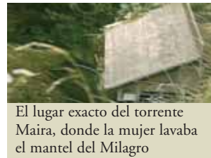
El lugar exacto del torrente Maira, donde la mujer lavaba el mantel del Milagro