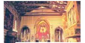
Interior de la Iglesia del SS. Cuerpo de Cristo