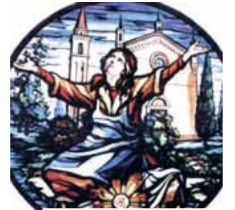
Iglesia de Gruario. Vitral con la representación del Milagro