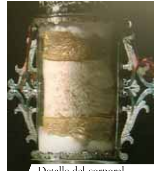
Detalle del corporal