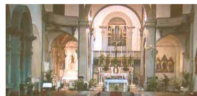
Interior de la Basílica de San Ambrosio

El primer Milagro ocurrió el 30 de diciembre de 1230. Un sacerdote llamado Uguccione, al momento de concluir la Misa no se dio cuenta que había dejado algunas gotas de vino consagrado en el cáliz; estas mismas se convirtieron luego en Sangre visible. El historiador Juan Villani hizo una cuidadosa descripción del Milagro: “al día siguiente, tomando nuevamente aquel cáliz, encontró dentro de él Sangre viva coagulada [...] ... esto fue manifestado a todas las mujeres de aquel monasterio y a todos los vecinos allí presentes, al Obispo y a todo el clero. También fue expuesto ante la vista de todos los Florentinos, los cuales, con gran devoción, se reunieron alrededor para observar. Luego, depositaron la Sangre en una ampolla de cristal, que aún hoy se