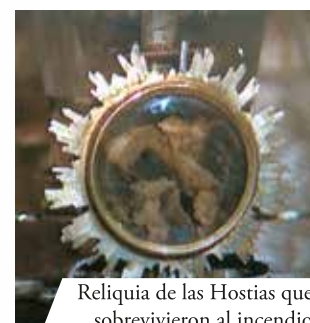
Reliquia de las Hostias que sobrevivieron al incendio