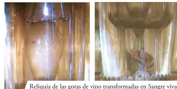
Reliquia de las gotas de vino transformadas en Sangre viva

El viernes Santo de 1595 una vela encendida, puesta sobre el altar de la capilla lateral, llamada del Sepulcro, cayó en el suelo causando un gran incendio. La gente se apresuró a socorrer tratando de domar el fuego y poder salvar el Santísimo Sacramento y el cáliz. En medio de la confusión general, seis Partículas consagradas cayeron de la pisa sobre la alfombra encendida en fuego. Pero a pesar de esto, fueron