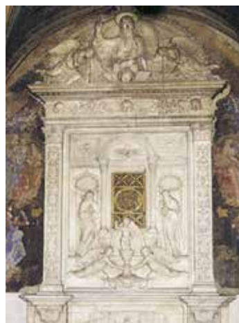
Tabernáculo, obra de Mino de Fiesole, donde se conservan las Reliquias de los dos Milagros