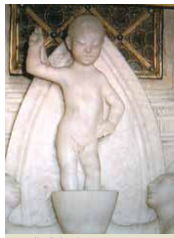
Detalle de las decoraciones presentes en el tabernáculo donde se custodian las Reliquias de los dos Milagros Eucarísticos