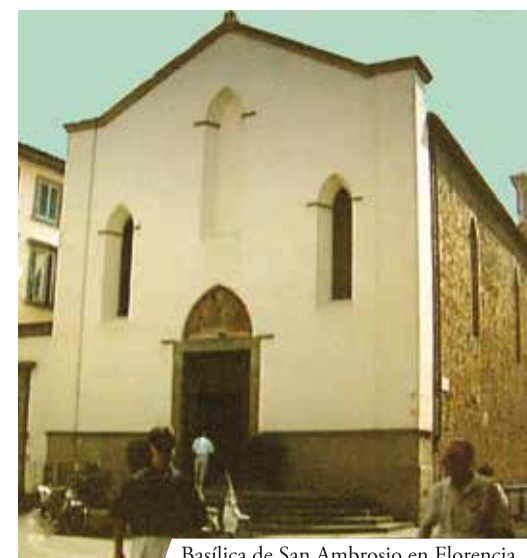
Basílica de San Ambrosio en Florencia