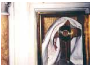
Tabernáculo donde se conservan las Hostias del Milagro