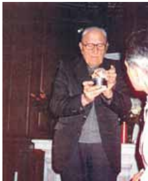
Año 1975. El párroco de la iglesia de San Pedro expone la Hostia de 1254

Accidentalmente, dejó caer una Hostia consagrada. Inclinandose para recogerla, ésta se elevó sola hasta posarse en el purificador. Luego, en vez de ella, apareció un espléndido niño que fue contemplado por todos los fieles y religiosos presentes en la celebración. A pesar de que son ya más de 800 años desde que ocurrió el Milagro, aún hoy es posible admirar la Hostia del Milagro. Todos los jueves del mes, en la iglesia de San Pedro de Douai, se reúnen numerosos fieles en un ambiente de oración delante de la Hostia Prodigiosa.