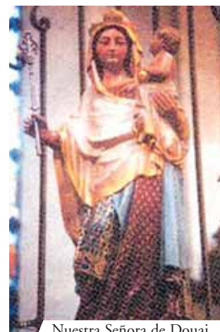
Nuestra Señora de Douai