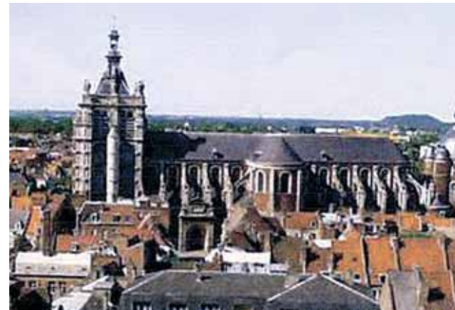
Fachada externa de la iglesia de San Pedro en Douai