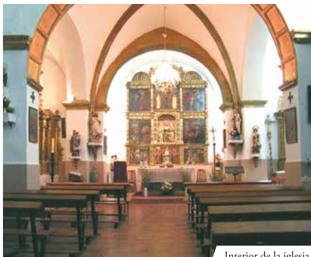
Interior de la iglesia