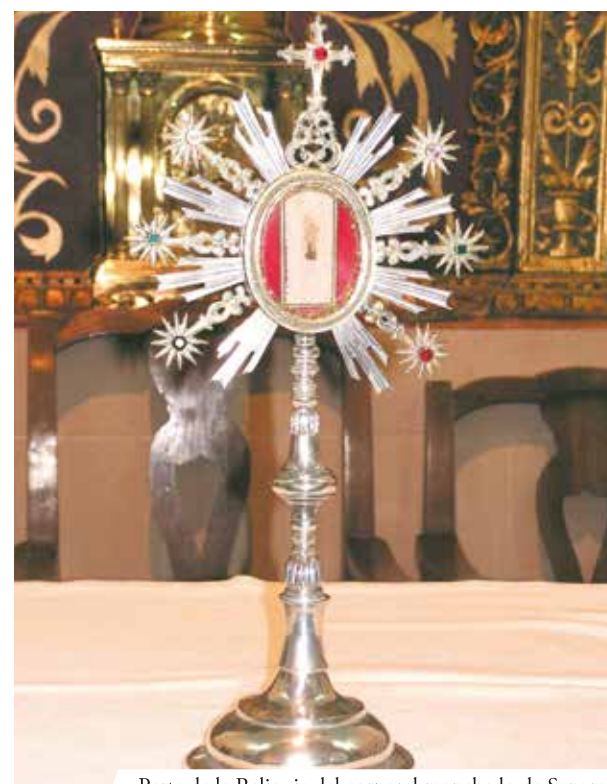
Parte de la Reliquia del corporal manchado de Sangre

milagros fueron atribuidos al “Santísimo Misterio Dudado” convirtiéndose así en objeto de gran devoción por parte de todos los fieles. La Reliquia del corporal manchado de Sangre se expone el 12 de septiembre de cada año, en ocasión del aniversario de la fiesta del Milagro.