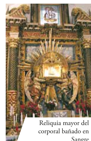
Reliquia mayor del corporal bañado en Sangre