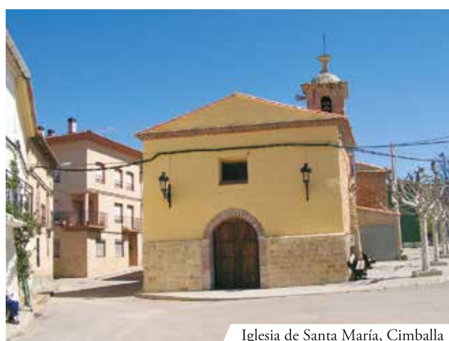
Iglesia de Santa María, Cimballa

Fue entonces que el sacerdote derramó lágrimas de arrepentimiento. Los fieles, viéndolo tan turbado, se acercaron al altar y pudieron ver también ellos el Milagro. La Reliquia fue llevada en procesión y la noticia se difundió por todos los alrededores. Sucesivamente, muchos