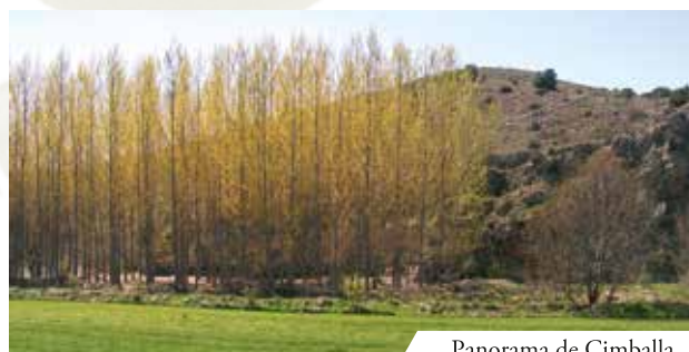
Panorama de Cimballa