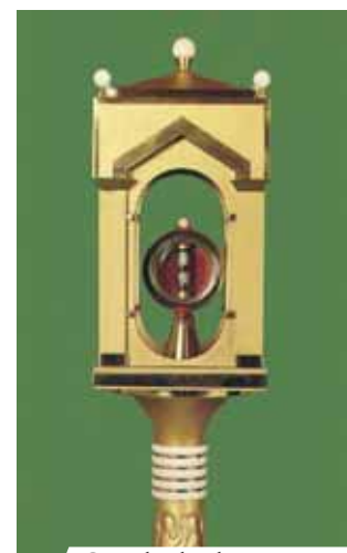
Custodia donde está conservada la Reliquia del Milagro