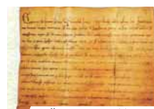
Bolla Fraternitatis Tuae del Papa Gregorio IX