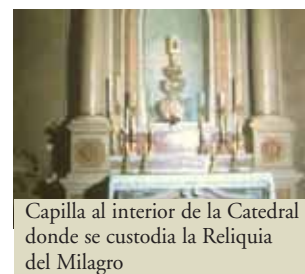
Capilla al interior de la Catedral donde se custodia la Reliquia del Milagro