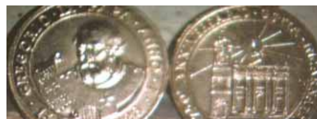
En 1978 se celebró solemnemente el 750° aniversario del Prodigio. En ocasión de la fiesta se acuñó una medalla que presenta en la parte anterior la imagen del Papa Gregorio IX con la Bula, y en la posterior, la fachada de la Catedral con la Hostia