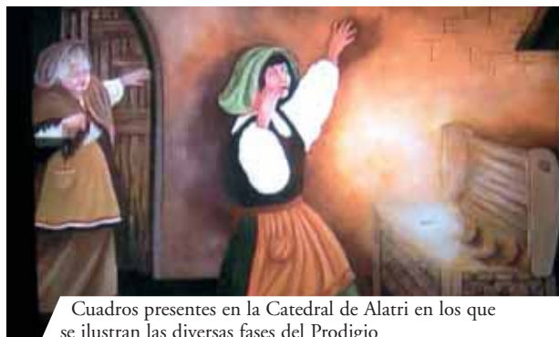
Cuadros presentes en la Catedral de Alatri en los que se ilustran las diversas fases del Prodigio

En Alatri se conserva hasta nuestros días la reliquia del Milagro Eucarístico ocurrido en el año 1228. La Catedral de San Pablo Apóstol custodia un fragmento de Hostia convertida en carne. Una mujer joven, con el fin de reconquistar el amor de su novio buscó una hechicera. Ésta le ordenó robar una Hostia consagrada para hacer con ella una brebaje de amor. Durante una Misa, la joven logró esconder una Hostia en una tela. Llegando a su casa se dio cuenta que la Hostia se había transformado en carne sangrante. Entre los numerosos documentos que certifican el hecho, destaca la Bula del Sumo Pontífice Gregorio IX.