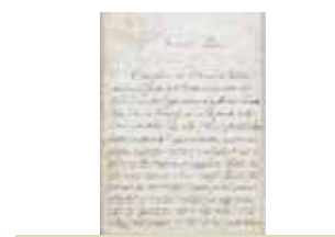
Carta del Rector de Santa María en las Terme, del 22 de marzo de 1888. En ella agradece por el don de una parte de la Reliquia de la Hostia milagrosa conservada en Alatri.