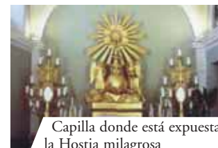
Capilla donde está expuesta la Hostia milagrosa