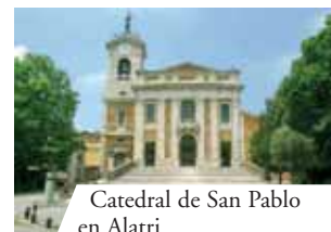
Catedral de San Pablo en Alatri